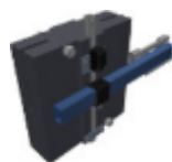
SGI-S* (65 kg) (Abb.Nr.3)